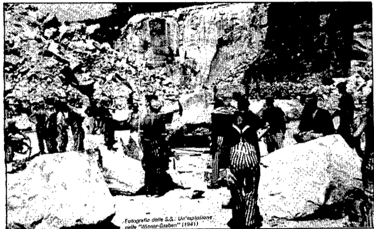
El treball a les pedreres va ser el mètode d'extermini utilitzat a Gusen. Una alimentació dels presoners basada en els naps i aigua bruta de "café", i l'esforç a què estaven sotmesos, eren la forma més brutal i segura de liquidar existències... (Foto: arxiu).