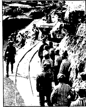
Quan passava l'oficial nazi, els presoners havíem d'aturar la feina i treure'n la gorra. (Foto: arxiu).